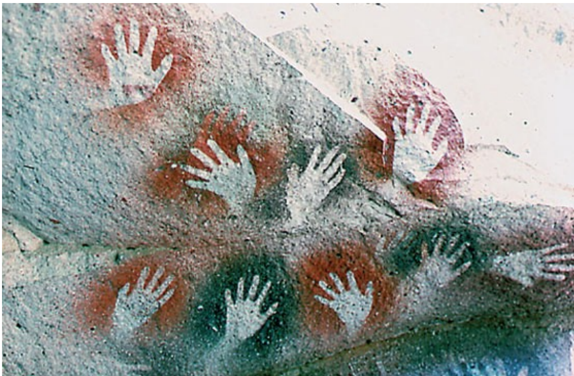
Mans de les coves de Altamira. Santander

Com a objectiu general, el curs proposa re-educar els nostres hàbits de moviment quotidià des de la mirada antropològica, que integra en una unitat l'aspecte biològic i l'aspecte cultural que li aporta significat.